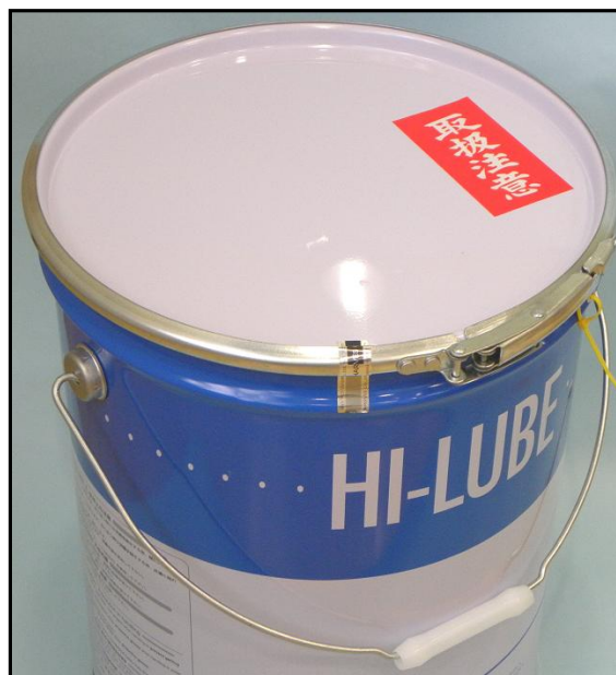
2) . 封印后的广口桶的手柄部照片