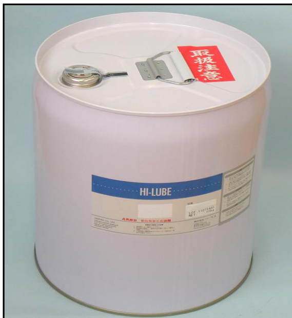
2) . 封印后的细口桶的桶盖部照片

2) . 9月1日起生产的制品、均用『封纸(B型・黑)』开始封印。(注意:照片是A型・黑封纸)