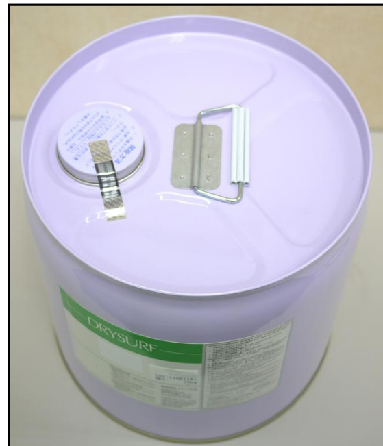
1). 用 B型・黒 封印的筒装瓶盖部照片