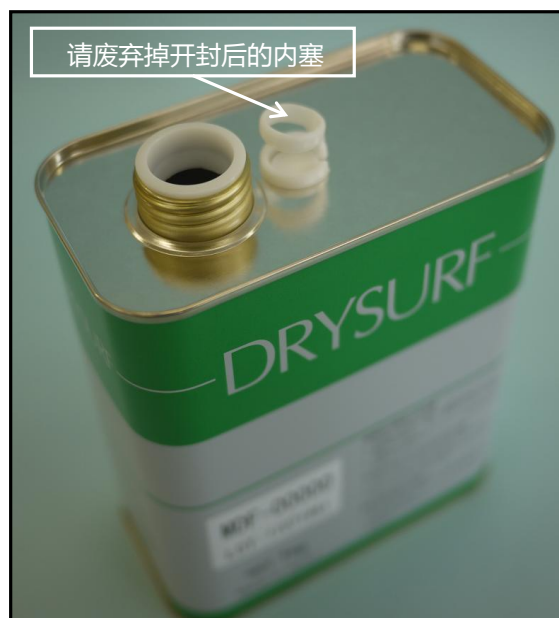
2) . 「拉环式内塞」被开封的状态