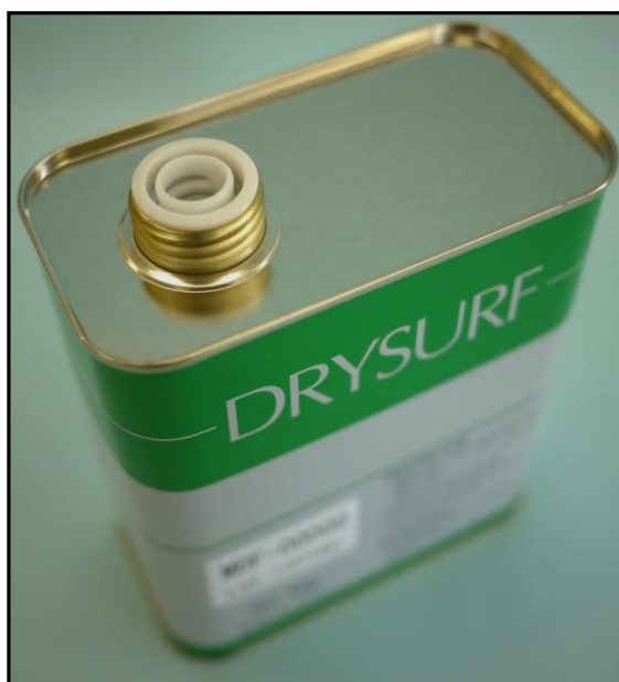
2) . 用「拉环式内塞」封住的状态

2) . 对于「拉环式内塞（一次性拉环内塞）」、9月1日以后的生产也将持续使用。