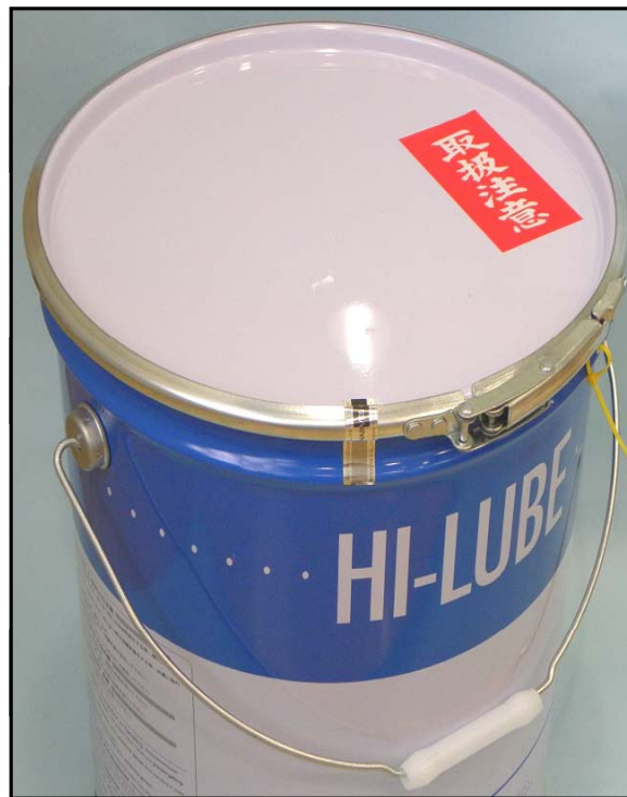
1). 封印したオープンペールのレバーバンド部写真