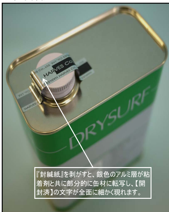
1). 『封緘紙』で封印した1kg缶キャップ部写真