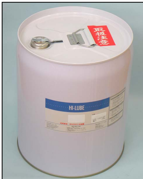
1). 封印した細口ペール缶のキャップ部写真