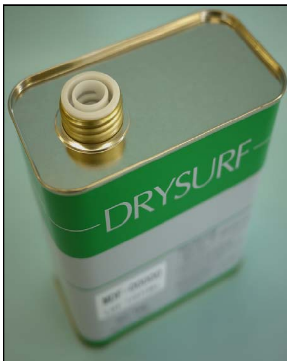
2). つまみポリ栓に変更した写真