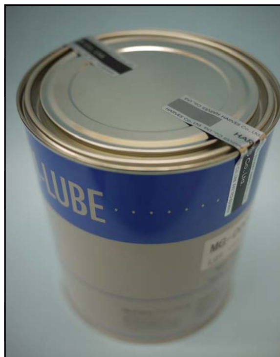
1). 封印したオレフィングリス用金属容器(1kg)写真