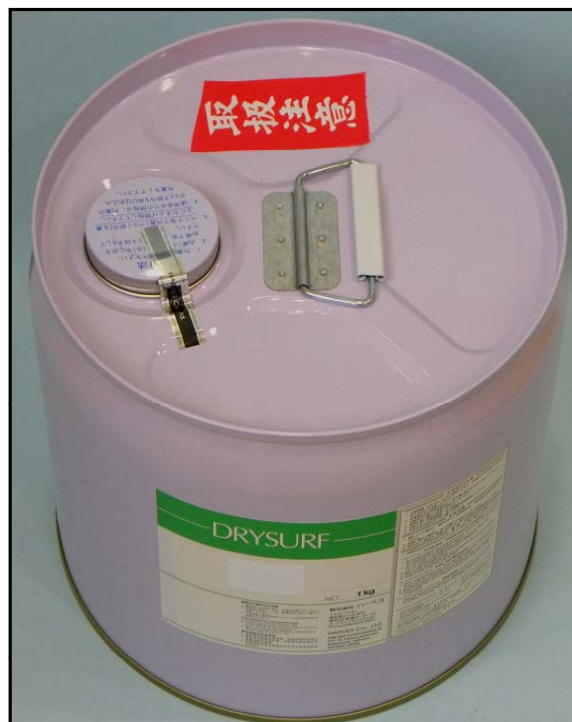
1). 『封緘紙』で封印したパール缶キャップ部写真