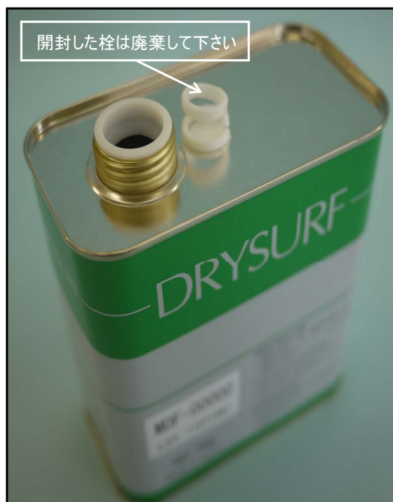
2). つまみポリ栓を開封した写真