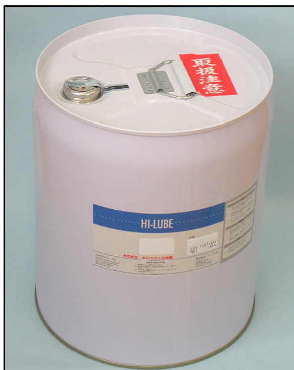
1). 封印后的细口桶罐的桶盖部照片