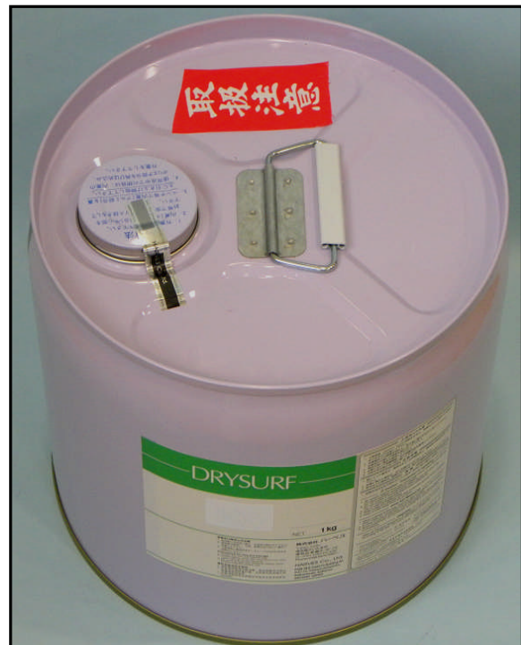
1). 用『封纸』封印的桶装瓶盖部照片