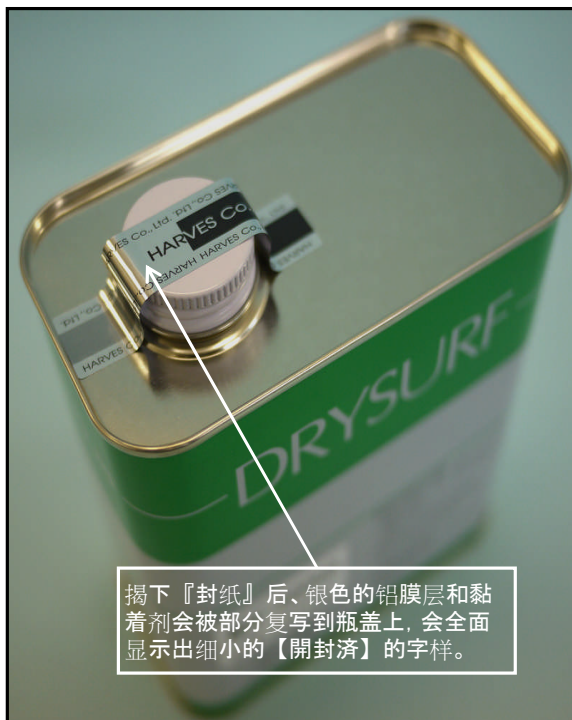
1). 用『封纸』封印的1kg罐的瓶盖部照片