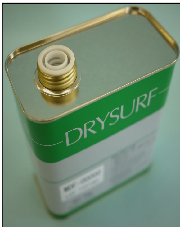
2). 使用拉环式内塞的照片