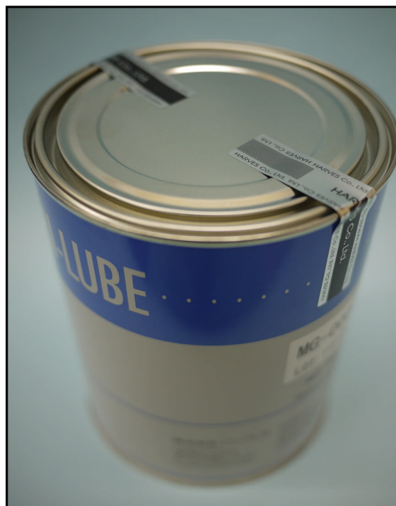
1). 封印后的合成油润滑脂用的金属容器 (1Kg) 照片