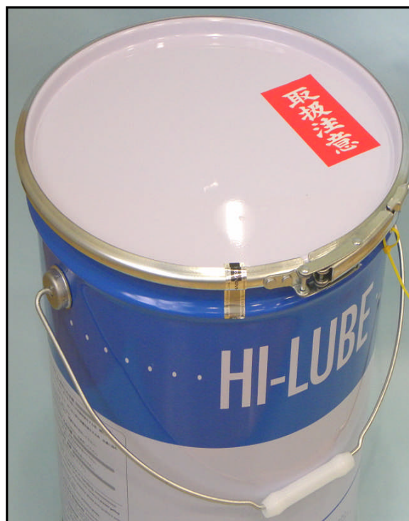
1). 封印后的广口桶的手柄部照片